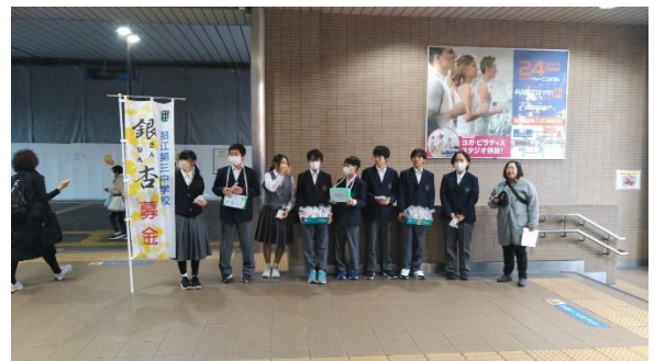
【11/21、22 地域貢献委員会による募金活動 狛江駅】