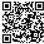
コミュニティスクール説明動画