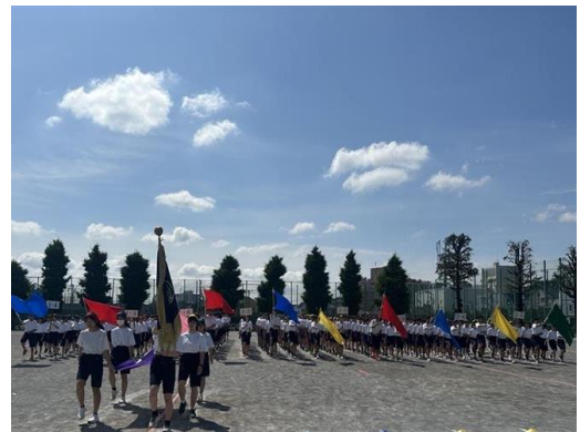
予行の入場行進の様子

5月31日に予定していました体育祭は、残念ながら雨天のため延期することとなりました。生徒たちは、各種競技や係活動等、この日に合わせて熱心に練習や準備を重ねてきました。日に日にチームの一体感、結束や気持ちの高まりを感じただけに、体育祭を待ち望むうずうずとした気持ちが伝わります。体育祭は、6月4日(水)以降の開催となります。生徒たちがこれまでの練習の成果を存分に発揮し、躍動する姿を今から楽しみにしています。保護者の皆様、地域の皆様のあたたかいご声援をよろしくお願いいたします。