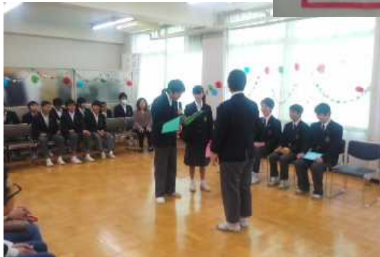
2年生から贈る言葉