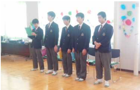
3年生からお別れの言葉