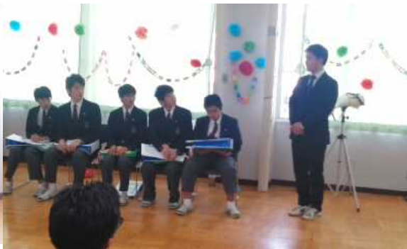
佐野先生からの言葉