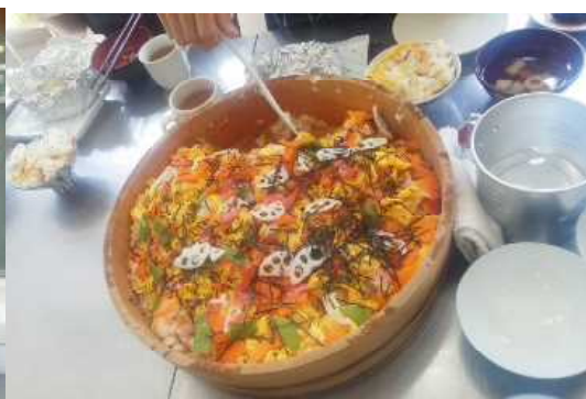
恒例の春らしい「ちらし寿司」