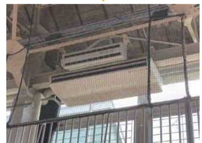
設置済みの空調（一例）