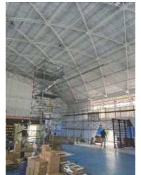
工事現場で施設課職員が打ち合わせをしている様子