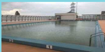
狛江第一小学校屋上プール写真 （プール清掃前）

プールには水をたくさん貯めておけるから、万が一火事が起きた時には貴重な水源になるんだよ！