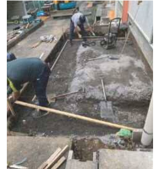
室外機置場の掘削作業中