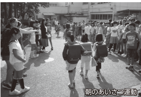
朝のあいさつ運動

特に、2では、いじめ防止に関する教育委員会の基本的な姿勢を以下のように示しています。