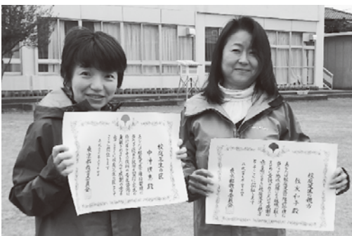
【問い合わせ】 学校教育課

狛江第五小学校の芝生の維持管理活動に継続的に取り組み、学校と地域の連携に貢献していることが認められ、それぞれ校庭芝生の親方、校庭芝生の匠として東京都教育委員会より認証されました。