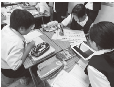
【問い合わせ】 指導室

本研究の取組は、生徒の主体的な学びを促す工夫としてだけでなく、生きる力の育成という視点からも、価値あるものとなりました。