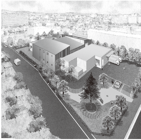
給食センター完成予想図