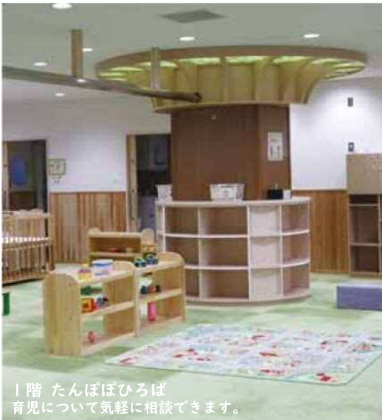
1階 たんぼひろば 育児について気軽に相談できます。