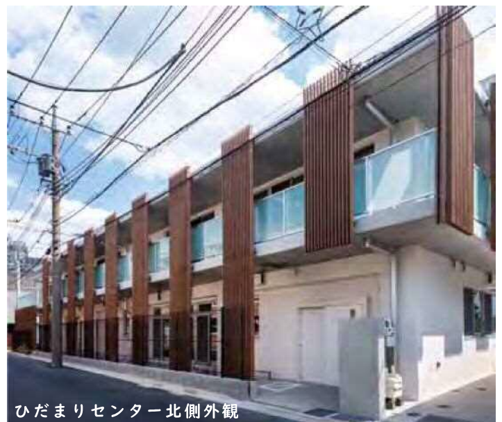
ひだまりセンター北側外観