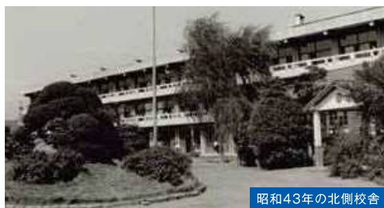
昭和43年の北側校舎

狛江第一中学校(通称一中)は、昭和22年に狛江で初めてとなる中学校として開校されました。開校当時は、戦後の資材不足と財政難の中、新しい校舎を作ることができず、四谷区教員農園の付属建物を借りてのスタートになりました。現在の地に校舎が建てられ、移転したのは、翌年の昭和23年。昭和36年に建てられた北側校舎(通称2号館)は、大規模改修等を経てはいるものの、建設当時の姿を残す、市内で最も歴史のある校舎です。