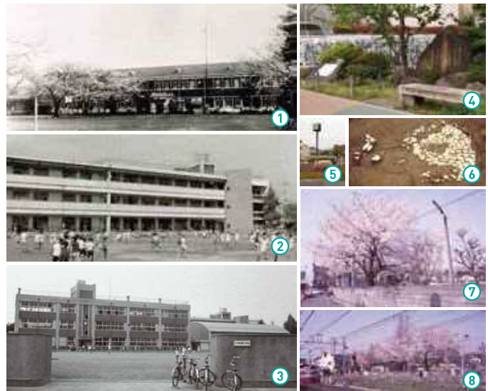
①昭和7年建設の校舎:村民の誇りだった校舎。昭和20年5月25日の空襲で焼失してしまいました。/②昭和35年建設の校舎:鉄筋3階建の校舎。南面開放廊下の校舎でした。/③昭和45年建設の南校舎:戦後に建てられた木造校舎は役目を終えました。/④狛江教育発祥の地記念碑:卒業生が小学校の思い出を記念碑として残しました。/⑤狛江第一小学校跡地記念碑:時計の下には一小跡地の発掘調査時に発見された⑥縄文時代の歌石住居がそのまま保存されています。/⑦⑧校庭の桜(昭和58年撮影):毎年入学式の頃に咲き誇り、子どもたちを迎えてくれました。

一小は、もともと狛江駅前(現在の北口ロータリー)に位置していましたが、昭和62年に、駅前の再開発にともない現在地へ移転しました。北口ロータリーの時計が建つ中央の島には、一小跡地の記念碑が立ち、かつての記憶を伝えています。また、一小跡地は、観聚学舎が創立した狛江の教育のスタート地点でもあり、交番の脇には教育発祥の地の記念碑が建てられています。