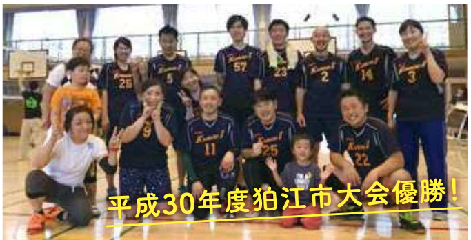
平成30年度狛江市大会優勝!

一小の先生たちで編成するバレー部が2018年春、狛江市大会で優勝しました。この優勝の背景には地域との絆が...?取材班は一小バレー部の強さの秘密をこっそり聞いてきました。