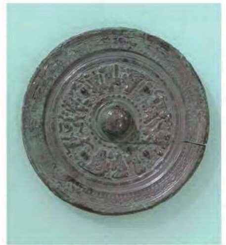
亀塚古墳から出土した神人歌舞画像鏡 現在は東京国立博物館に収蔵されています。

出土品の中でも注目すべきは、「 しんじん 神人歌舞画像鏡」と呼ばれる鏡で、その名のおり鏡面の裏に神人が歌舞する姿が鑄出されています。この鏡は、後漢の時代（後漢末に有名な三国志のストーリーが始まります）の中国にて造られたもので、それが狛江の亀塚古墳から発見されたのです。おそらく、中国からもたらされた鏡が、畿内の有力豪族の手に渡り、長い年月と多くの人の手を経て、亀塚古墳の被葬者の手に渡ったのではないかと考えられます。古代の中国で造られた鏡が狛江の古墳の長の手に渡る、想像してみるとなかなか壮大なストーリーです。