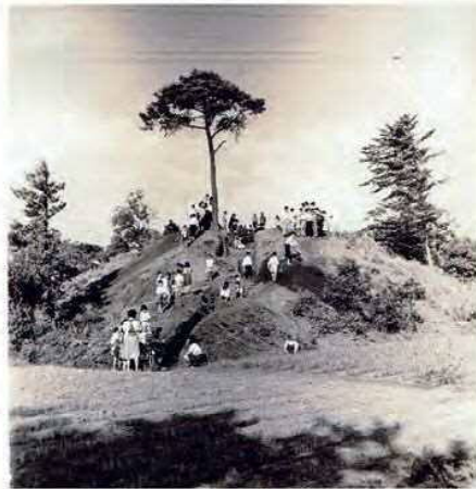
発掘当時の亀塚古墳

1951年、墳丘が削られているのを目にした地元の有志は、亀塚古墳が壊されてしまうと危ぶみ、古墳を守るため緊急の発掘調査を行いました。この発掘調査の成果によって、亀塚古墳はその存在を広く知られるようになりました。出土した数々の副葬品から、その被葬者は狛江古墳群の盟主とされ、「狛江百塚」と呼ばれる古墳群に眠る者どもを従えていたのではないかと考えられました。