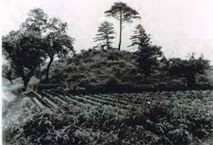
ありし日の亀塚古墳

亀塚古墳は、数ある狛江の古墳の中でも、とりわけ重要な古墳です。最大長約40m、高さ約7mを測り、帆立貝の形をした狛江で唯一の前方後円墳でした。残念ながら、現在の亀塚古墳は、往時の姿をほとんど留めていません。1950年頃から墳丘が削られはじめ、今では前方部の一部を残すのみとなっています…。