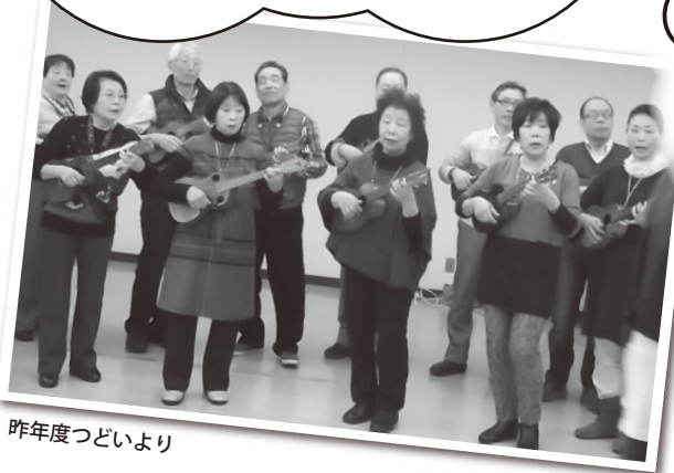
昨年度つどいより

新規会員を募集している団体が たくさんあります。新しい趣味や、 お仲間をお探しの方は公民館 窓口にご相談ください。