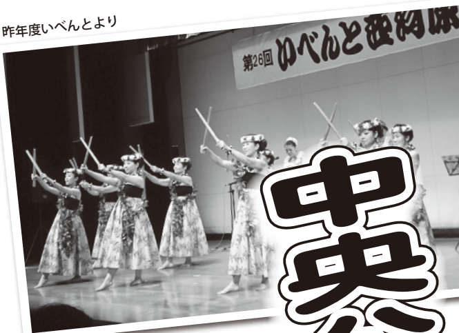
昨年度いべんとより

〒201-8585 狛江市和泉本町1-1-5 TEL / 03-3488-4411 FAX / 03-3480-3341 E-mail chukou@city.komae.lg.jp