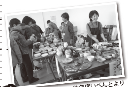
昨年度いべんとより