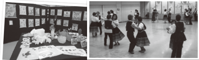
昨年度つどいより

公開活動 ハーモニカ・マンドリン・ギター・ウクレレ・カラオケ・ バラライカ・コカリナ・太極拳・ヨガ・フォークダンス・ 気功・ジャズダンス・和菓子づくり・歴史研究・手芸・ 手話・英会話・囲碁・将棋・ポタニカルアート