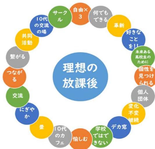
図1 理想の放課後を一言で

もちろん、ソファや畳を置いてほしいなど、落ち着ける空間がほしいという意見も。ティーンズルームの雰囲気づくりにとても参考になりました。