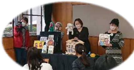
コンテューゴあなたといっしょ