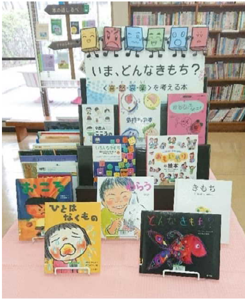
4月 )いま、どんなきもち？