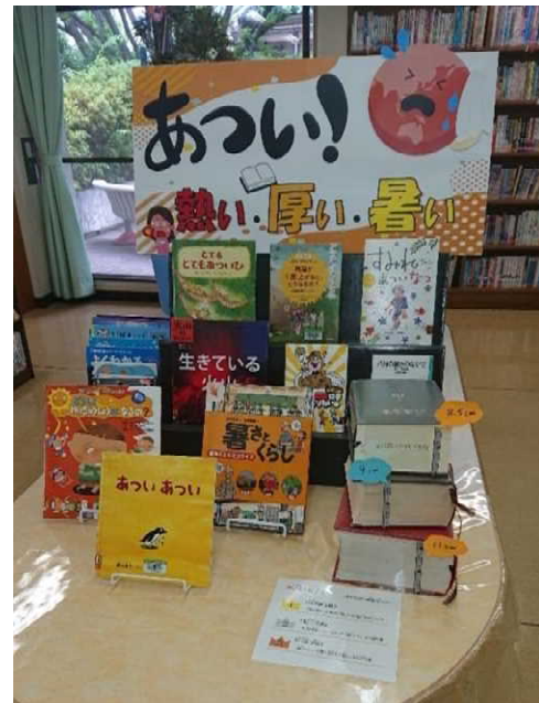
8月 )あつい！ 熱い厚い暑い