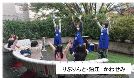
りぷりんと・狛江 かわせみ