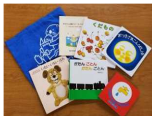
【ブックスタートパック】