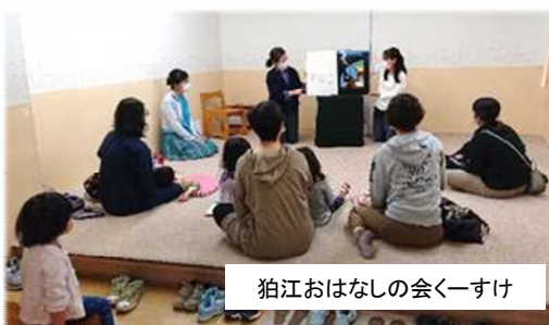
狛江おはなしの会くーすけ