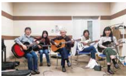
Love & Peace