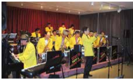
イズミスイングオーケストラ

問 音楽の街-狛江 エコルマ企画委員会事務局((一財)狛江市文化振興事業団) ☎(3430) 4106(土・日曜日、祝日を除く午前8時30分〜午後5時)