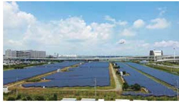
夏休みに環境について学ぼう