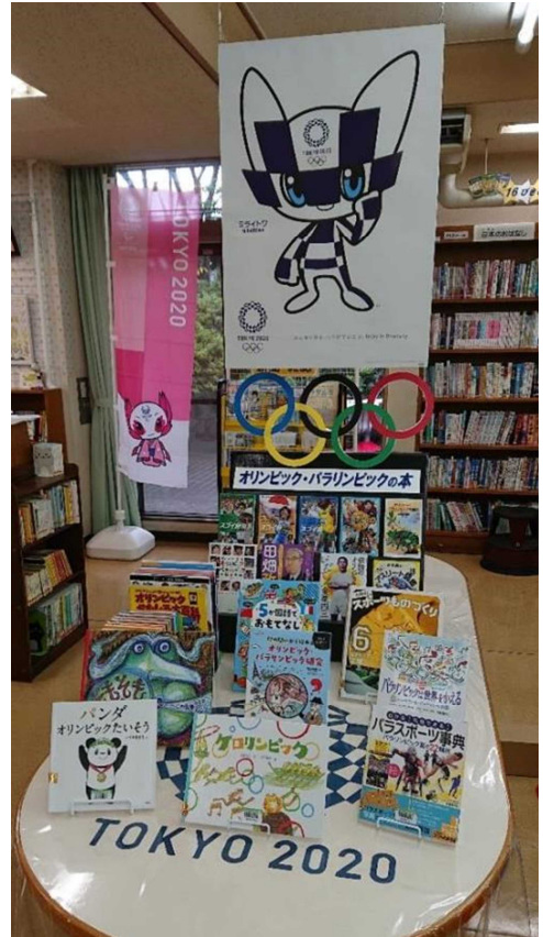
7月) オリンピック・パラリンピックの本