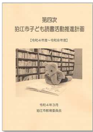
令和4年3月発行 (A4判無線綴じ 108頁 160円)

令和3年度は「第四次狛江市子ども読書活動推進計画」の策定に取り組みました。子どもの読書活動を推進するには、従前どおり、成長段階に合わせた取組を行っていくことが必要です。子どもに直接働きかける読書活動を継続していく上で、新しい生活様式に配慮しながら、関係部署と連携して子どもの読書環境や諸条件の整備に努めます。