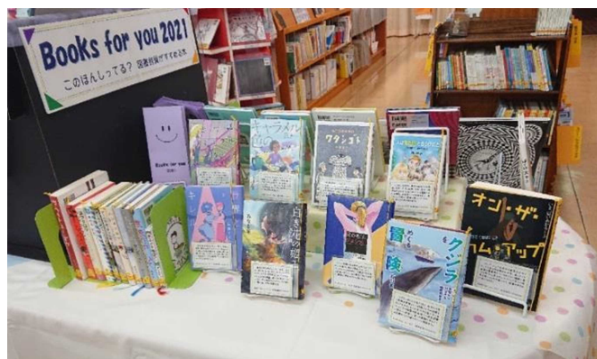
6月) Books for you 2021 図書館員がすすめる本