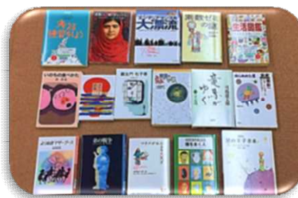
【サードブック対象本】