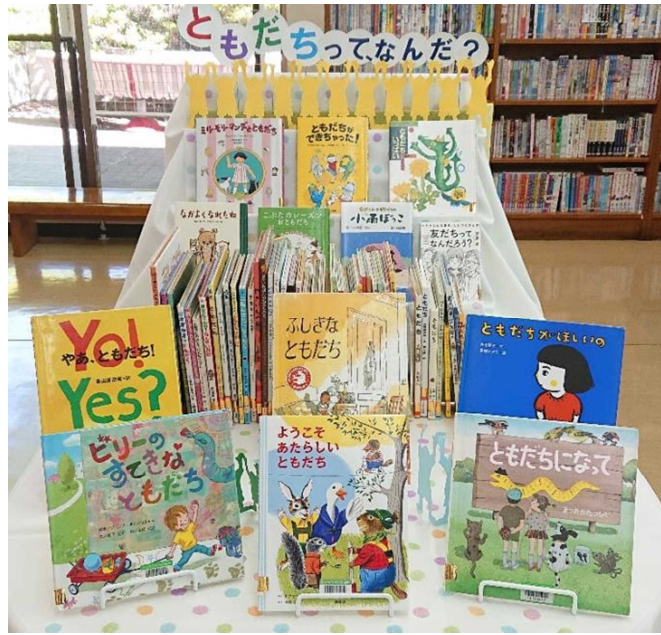
4月) ともだちってなんだ？