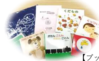
【ブックスタートパック】