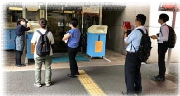
【写真↑】児童の来館は見合わせ、担当教員のみ見学を実施。教員が情報を持ち帰り、事前に図書館が配布した資料と併せて児童にレクチャーを行った。