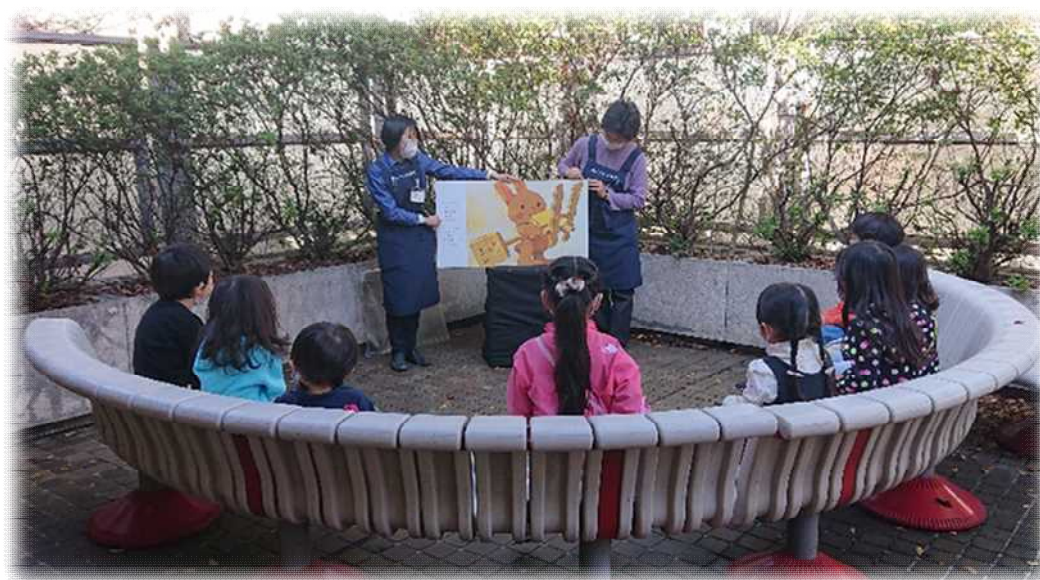
【屋外テラスで実施した「青空おはなし会」の様子】

子ども向けのおはなし会事業は、市内のおはなしグループや個人登録のおはなし会ボランティアの協力を得ながら、絵本の読み聞かせを中心に手遊び歌や折り紙工作などを交えたプログラムで行う定例会の他に、クリスマスなど季節のおはなし会や土曜日開催のおはなし会など、さまざまな機会をつくってきました。令和3年度は、定例会形式のおはなし会を見直した「えほんのじかん」を継続すると共に、屋外テラスで「青空おはなし会」を試行しました。