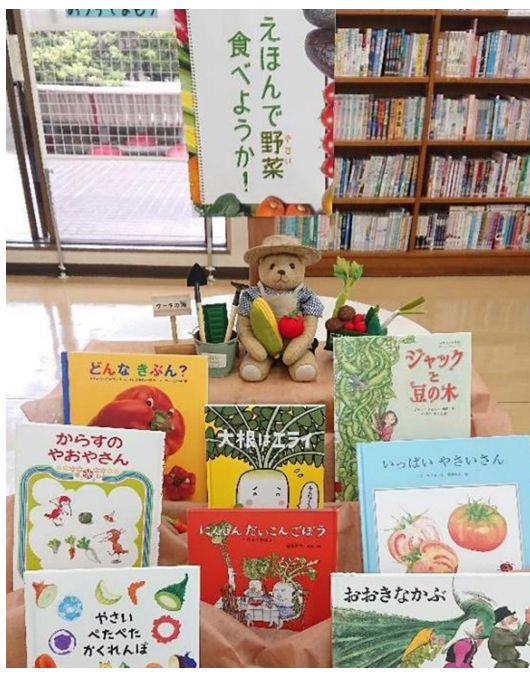
6月) えほんで野菜食べようか！