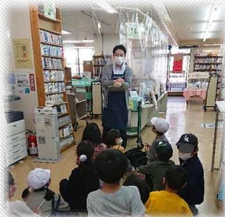
【小学校2年生の図書館施設見学の様子】