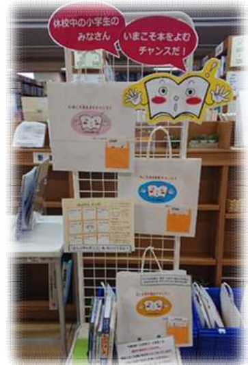
【中央図書館のお楽しみ袋】