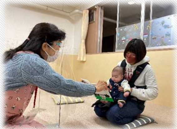
【3・4か月児を対象としたブックスタート事業の様子】