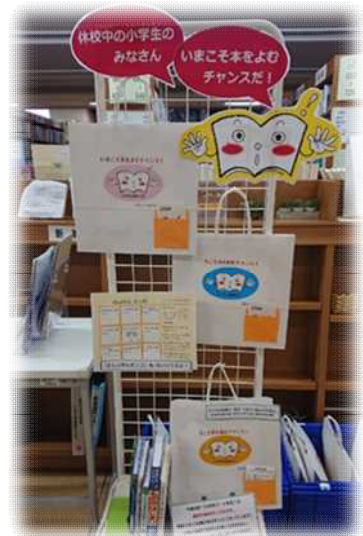
【中央図書館のお楽しみ袋】