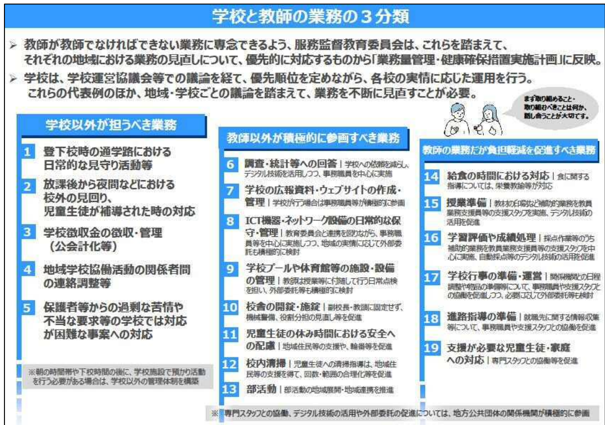
「学校と教師の業務の3分類」（文部科学省）より