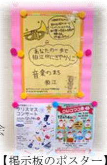
【掲示板のポスター】