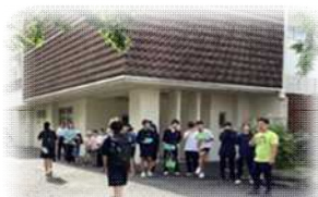
【二中での挨拶運動】

中学生が小学校と一緒に挨拶する運動はこれまでもありました。今年度は小学生が中学校へ行って一緒に挨拶をする取組もしました。