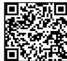
学校ホームページ