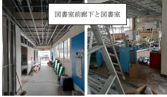
図書室前廊下と図書室