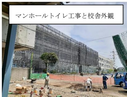
マンホールトイレ工事で校舎外観

さて、児童の皆さんはこの夏休みはどのように過ごしたでしょうか？新型コロナウイルス感染は第7波が猛威を振るい、1日の感染者数が3万人を超え、子供たちの感染も増えましたが、今までのような制限はなかったので、お出かけできた人も多く、ここ数年の休みとは違ったという人もいたのではないのでしょうか。2学期もしばらくは、残暑が続きますので、コロナ対策と熱中症対策のバランスをとりながら、健康に過ごし、充実した学校生活を送ってほしいと願っています。