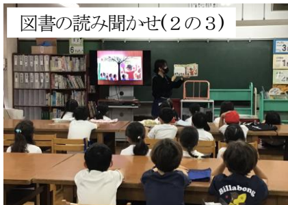
図書の読み聞かせ(2の3)