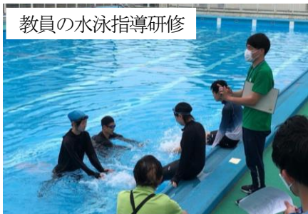
教員の水泳指導研修