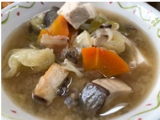
狛江市では、新型コロナウイルス感染症拡大の影響で魚の消費が低迷している鹿児島県鹿屋市産カンパチの支援のため、鹿児島県を通じて無償提供される鹿屋産カンパチを12月より市内の小・中学校の給食で提供しています。今日(上)は、「カンパチのサイコロステーキ丼」1月21日(左)は「カンパチの味噌汁」が提供されました。いずれも絶品！！大変美味しくいただきました。