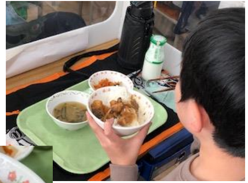
3-1に取材が入りました。皆おいしそうにほおぼっていました。もちろんおかわりは大行列！！