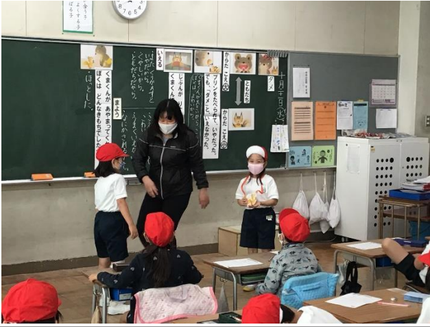
1年3組 道徳「勇気を出して」(善悪の判断) ねらい：よいと思ったことは、勇気を出して行おうとする態度を育てる。※紙芝居やロールプレイ等を通して、子供たちに実感させる工夫をしました。