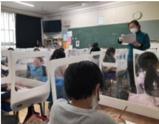
市教委から、個人の専用パーティションが届きました。小集団での話し合いなど、学習活動の幅が広がっていきます。