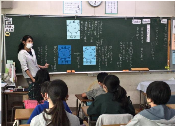
6年2組 特別活動「コロナウイルスの3つの顔を知ろう～負のスパイラルを断ち切るために～」 ねらい：コロナウイルスの現状を通して、差別のない社会を創り出そうとする態度を養う。 ※児童アンケートなどをもとに、コロナ禍における課題を知り、よりよい生き方を考えました。