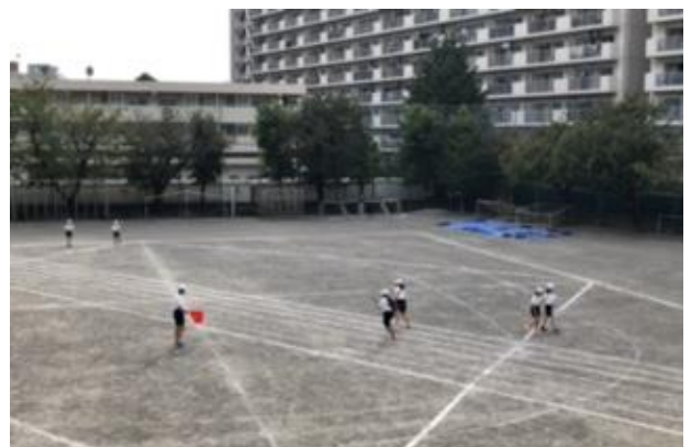
秋空の下、50m走の測定が始まりました。久しぶりに直線を全力で走る姿は、楽しそうでした。