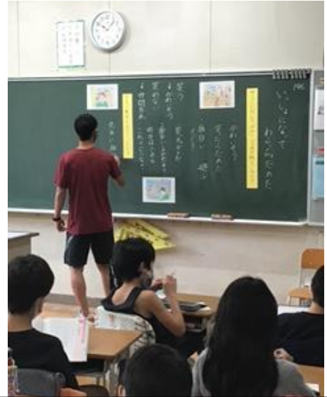
4年2組 道徳「わらっちゃだめだ」(善悪の判断) ねらい：正しいと思うことは自信をもって行おうとする態度を育てる。※ワークシートや発表を通して自分の考えを深めました。