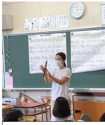
3年生リコーダーの指導の様子です。

音楽では、現在、息を吹いて演奏する楽器については、演奏ができない状況です。初めて使う学年では、正しい扱い方や演奏の仕方などの指導を行っています。実際の演奏は、ご自宅をお願いすることになりますが、よろしく願いいたします。