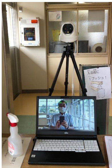
サーモセンサーが2階入口に設置されました。入校の際は、必ず体温をお計りください。

嬉しいニュースです。少年野球チーム（ホームライオンズ）がジャビットカップ狛江市大会で優勝しました！練習再開から僅か一か月少しのことですが、お見事です！全校朝会での表彰の代わりに、校長室で表彰を行いました。おめでとう。