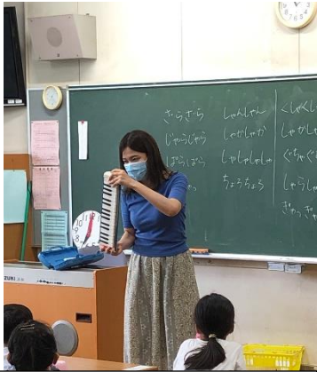
1年生鍵盤ハーモニカの指導の様子です。