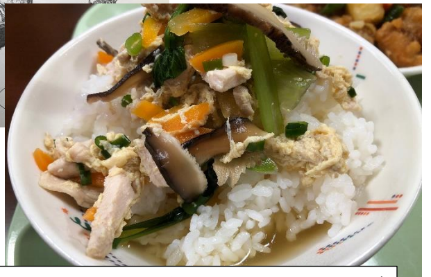
今日の給食は、奄美大島の「鶏飯」です。出汁がよく出ていておいしくいただきました！