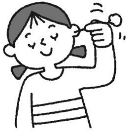
定期的に耳掃除をする (しすぎにも注意)