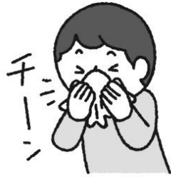
鼻をつよかみすぎない (片方ずつ)