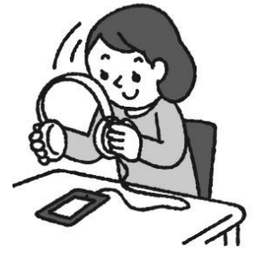
ヘッドフォンの音量は控えめに(時間を決めて)