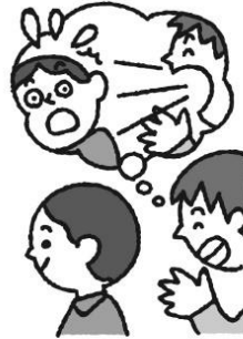
人の耳元で大声を出さない (ふざけて叩いたりしない)