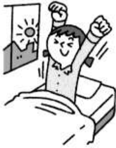
睡眠をたっぷりとる