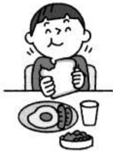
朝ごはんをしっかり食べる