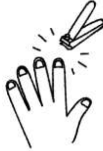
ツメを切っておく