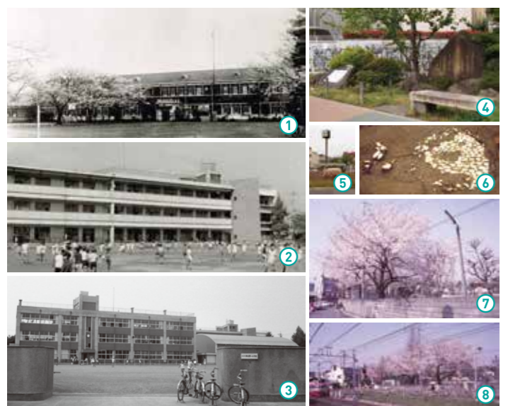
①昭和7年建設の校舎:村民の誇りだった校舎。昭和20年5月25日の空襲で焼失してしまいました。/②昭和35年建設の校舎:鉄筋3階建の校舎。南面開放廊下の校舎でした。/③昭和45年建設の南校舎:戦後に建てられた木造校舎は役目を終えました。/④狛江教育発祥の地記念碑:卒業生が小学校の思い出を記念碑として残しました。/⑤狛江第一小学校跡地記念碑:時計の下には一小跡地の発掘調査時に発見された⑥縄文時代の敷石住居がそのまま保存されています。/⑦⑧校庭の桜(昭和58年撮影):毎年入学式の頃に咲き誇り、子どもたちを迎えてくれました。

一小は、もともと狛江駅前(現在の北口ロータリー)に位置していましたが、昭和62年に、駅前の再開発にともない現在地へ移転しました。北口ロータリーの時計が建つ中央の島には、一小跡地の記念碑が立ち、かつての記憶を伝えています。また、一小跡地は、観聚学舎が創立した狛江の教育のスタート地点でもあり、交番の脇には教育発祥の地の記念碑が建てられています。