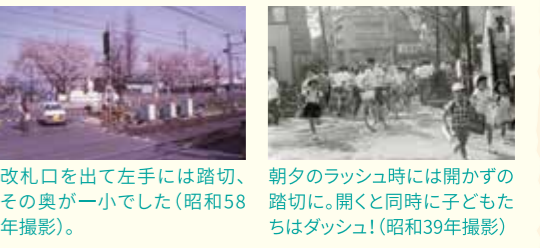
改札口を出て左手には踏切、その奥が一小でした(昭和58年撮影)。朝夕のラッシュ時には開かずの踏切に。開くと同時に子どもたちはダッシュ!(昭和39年撮影)

— 今や人口8万人を超える猪江市。まちの発展には様々なターニングポイントが。小田急線の高架化と猪江駅北口再開発もその一つ。地域の変化を探るため、いざ猪江駅前へ BACK TO THE SHOWA!!