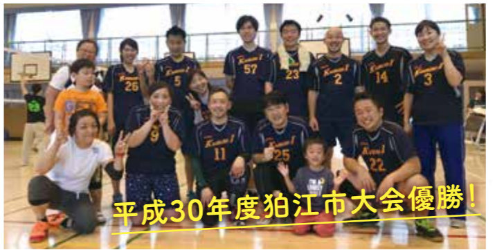
平成30年度狛江市大会優勝!

一小の先生たちで編成するバレー部が2018年春、狛江市大会で優勝しました。この優勝の背景には地域との絆が...?取材班は一小バレー部の強さの秘密をこっそり聞いてきました。