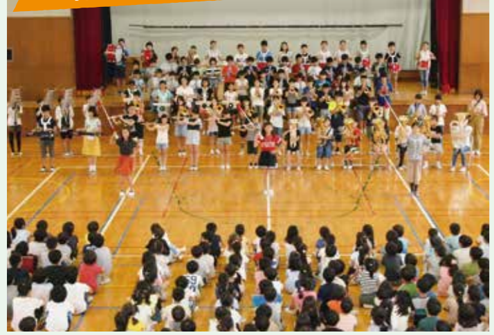
活動人数:93名 練習場所:音楽室 練習日:音楽の授業時間や朝、休み時間、放課後など 年間の活動:音楽集(7月)、運動会(10月)、市民まつり(11月)、6年生を送る会(3月)