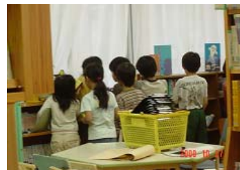
本を選ぶ子どもたち

「これ、借りていいの？」と、言ってもらえるのが、司書には一番うれしい反応でしたが、各クラスに配ってあるため、「教室で借りてくださいね。」と答えました。二度目の「味見読書」の時に、高学年では、「この前の本を読んでもいいの？」と聞かれました。いい本といい出会いをした子もいました。