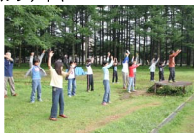
さわやかな朝の体操