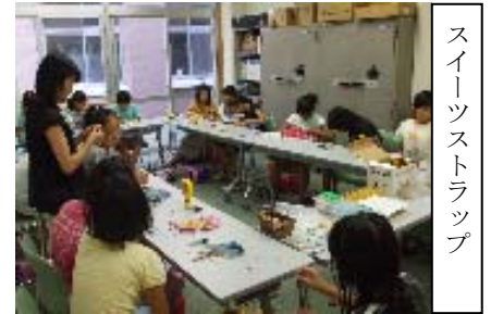
スイーツストラップ