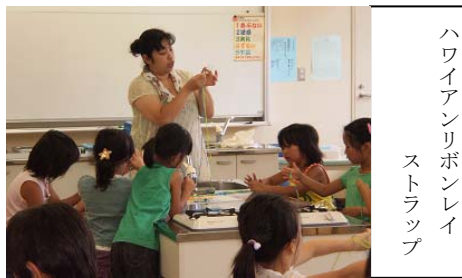
ハワイアンリボンレイ ストラップ