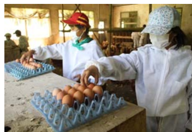
自然や動物に触れた農業体験

期待と不安に胸を膨らませて、一人の欠席もなく、5年生101名で出発した八ヶ岳林間学校。ハイキングでは、「頂上が見えたよ。がんばろう！」と励まし合い、農業体験では、「産み立ての卵って温かいのだね。」と命のぬくもりを感じ、そして、部屋では、「食事までに、荷物の片付けを済ませよう。」と見通しをもった行動を互いに呼びかける。そんな子供たちのいきいきとした姿に、高学年としての頼もしさと成長を感じました。