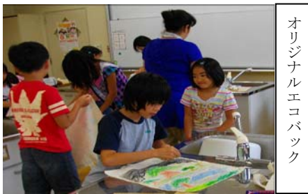
オリジナルエコバック