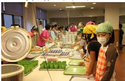
ハイキングでの食事