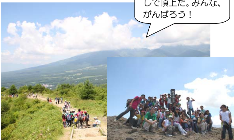
八ヶ岳を望みながらの飯盛山ハイキング