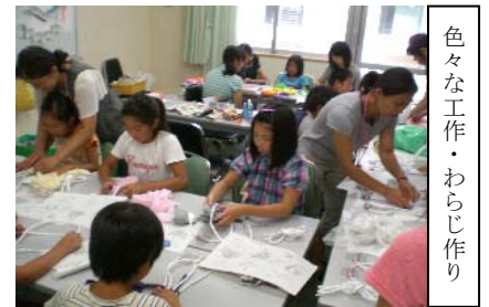
色々な工作・わらじ作り