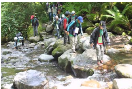
美し森ハイキング