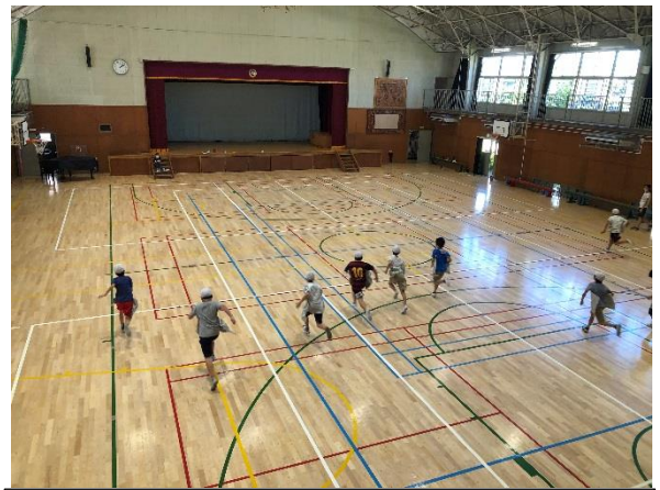
胴体に広げた新聞紙を落とさないように走ります。簡単そうに見えて結構難しい・・・。