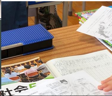
5年、考える社会の授業。自分たちが予想した根拠を、資料から読み取ります。