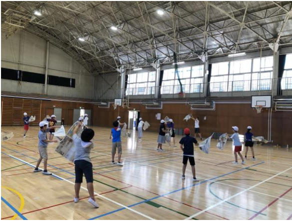
6年生の体育。新聞紙を使った、変わった、でもとても楽しい授業が展開されていました。