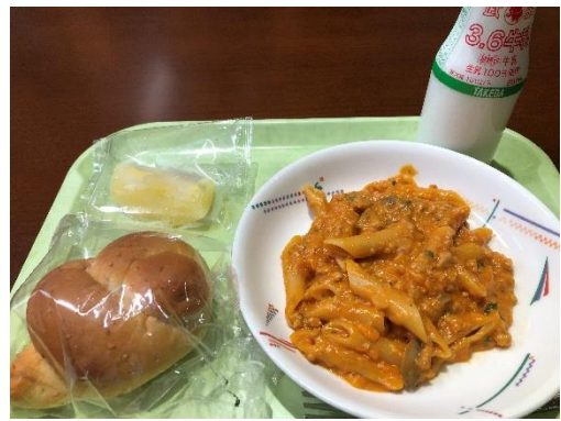
パンネのミートソース煮、パン、冷凍リンゴ。今日も、おなかいっぱいです。