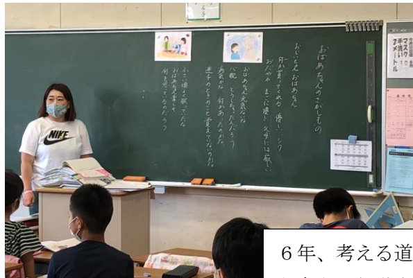
6年、考える道徳の授業。自分だったらどう考え、行動するか。真剣に考えます。